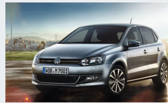
Polo MATCH 1,2 l 44 kW 5-Gang