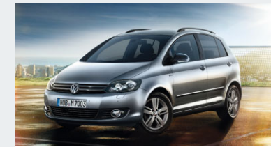
Golf Plus MATCH 1,4 l 59 kW 5-Gang

Ein Finanzierungsangebot der Volkswagen Bank GmbH für Privatkunden und gewerbliche Einzelabnehmer mit Ausnahme von Sonderkunden. Wartung und Inspektion sind ein Angebot der Volkswagen Leasing GmbH.