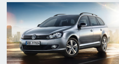
Golf Variant MATCH 1,4 l 59 kW 5-Gang

Anzahlung 6.517,50 €; Einmalprämie KreditschutzbrieftPlus (optional) 787,74 €; Nettodarlehensbetrag 15.995,27 €; Sollzinssatz (gebunden) p.a. 1,88%; effektiver Jahreszins 1,90%; Laufzeit 48 Monate; jährliche Fahrleistung 10.000 km; monatliche Finanzierungsrate inkl. Kreditschutzbrieft (optional) à 155,80 €; Schlussrate 9.485,13 €; Gesamtbetrag 16.963,53 €; Wartung und Inspektion, Garantieverlängerung, Kfz-Versicherung und Kaufpreisschutz monatlich 74,37 €. Kraftstoffverbrauch auf 100 km innerorts / außerorts / kombiniert 8,7 / 5,4 / 6,6 Liter; CO 2 -Emission kombiniert 154 g/km.