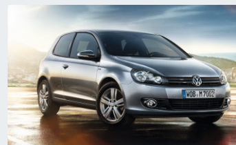
Golf MATCH 1,4 l 59 kW 5-Gang

Anzahlung 4.560,00 €; Einmalprämie KreditschutzbrieftPlus (optional) 560,78 €; Nettodarlehensbetrag 11.200,78 €; Sollzinssatz (gebunden) p.a. 2,86%; effektiver Jahreszins 2,90%; Laufzeit 48 Monate; jährliche Fahrleistung 10.000 km; monatliche Finanzierungsrate inkl. Kreditschutzbrieft (optional) à 102,74 €; Schlussrate 7.399,32 €; Gesamtbetrag 12.270,84 €; Wartung und Inspektion, Garantieverlängerung, Kfz-Versicherung und Kaufpreisschutz monatlich 65,18 €. Kraftstoffverbrauch auf 100 km innerorts / außerorts / kombiniert 7,3 / 4,5 / 5,5 Liter; CO 2 -Emission kombiniert 128 g/km.