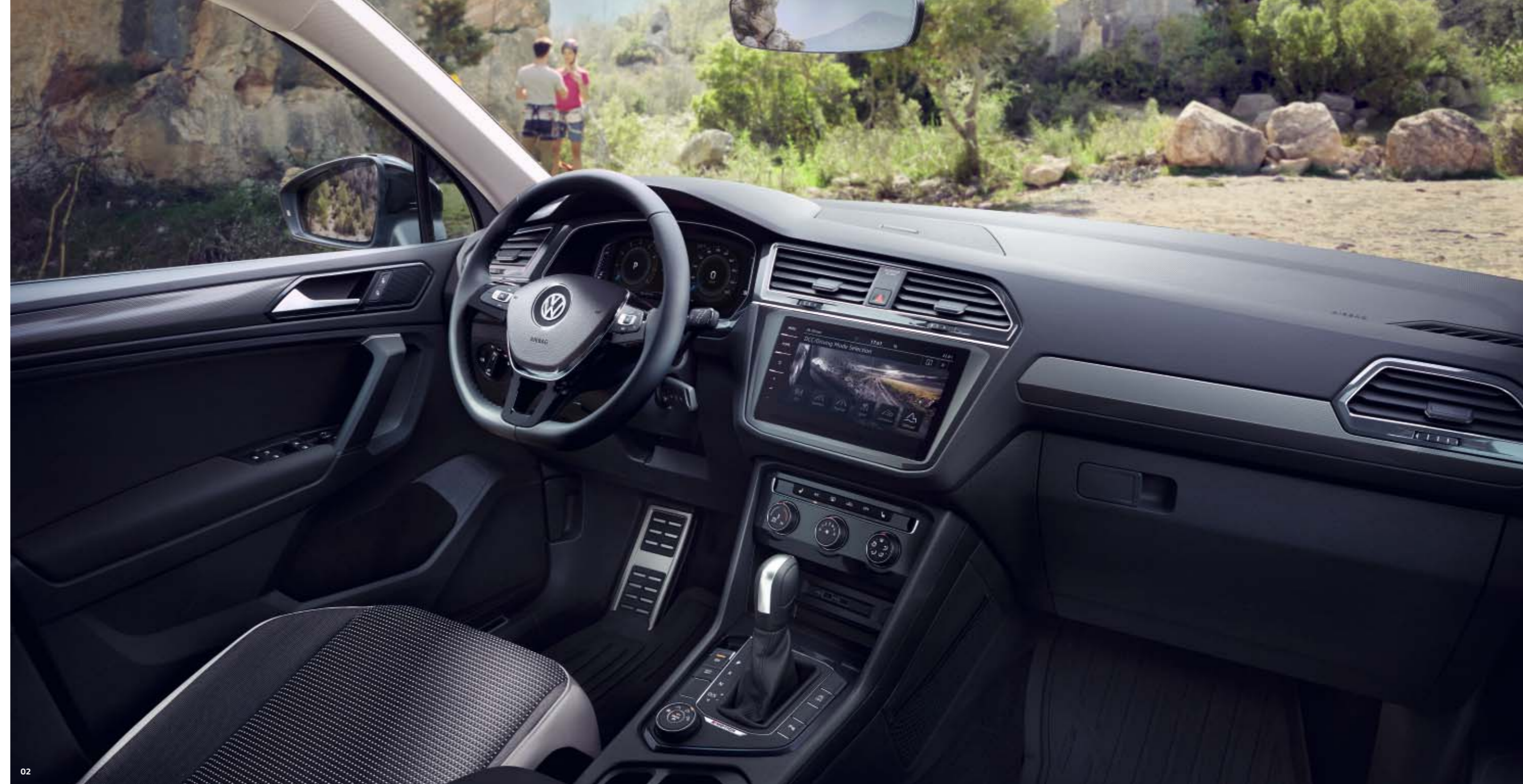
Abb. 02 zeigt das optionale Digital Cockpit und das optionale Navigationssystem „Discover Pro“.

02 Bereit für Herausforderungen. Und hohe Ansprüche: der Innenraum. Dafür sorgen zum Beispiel die bequemen Komfortsitze vorn mit Sitzmittelbahn in Stoff „Austin“ . Genauso wie die Aluminium-Dekor-einlagen verhelfen sie dem Cockpit zu einem noch dynamischeren Auftritt. Ebenso wie die Pedale und Fußstütze in Edelstahl gebürstet oder die robusten Gummifußmatten . Aber auch technisch kann sich das Interieur sehen lassen. Zum Beispiel dank des Radios „Composition Colour“ . S