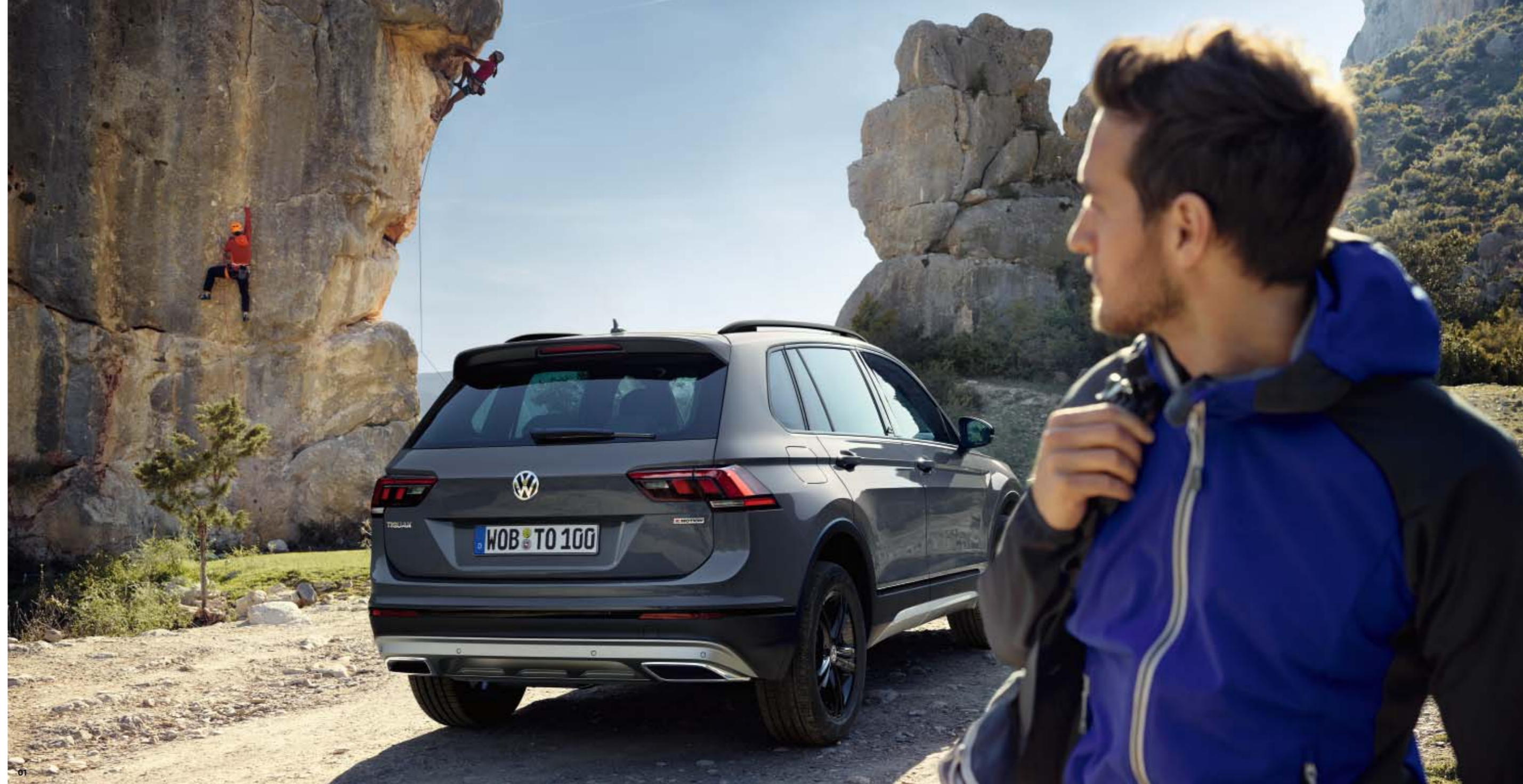
Abb. auf dem Titel und dieser Seite zeigen das optionale Active Lighting System.

01 Sehenswert. Nicht nur im Gelände: der Tiguan OFFROAD. Bereits der prominente Grill mit den vier optionalen charakteristischen Chromleisten lässt erahnen, dass er über jede Menge Selbstbewusstsein verfügt. Ein Eindruck, den die serienmäßigen LED-Scheinwerfer zusätzlich unterstreichen. Sie führen die prägnante Linienführung des Kühlergrills gekonnt fort. Auch der Offroad-Stoßfänger mit größerem Böschungswinkel und der Unterfahrschutz sind ebenso funktional wie eindrucksvoll. Zusammen mit diversen schwarzen Exterieur-Highlights wie den 18-Zoll-Leichtmetallrädern „Sebring“ , der Dachreling sowie den Außenspiegelgehäusen und dem Heckspoiler in Wagenfarbe hinterlässt der Tiguan OFFROAD überall Eindruck. Und ist darüber hinaus auch für Herausforderungen bestens gewappnet. S