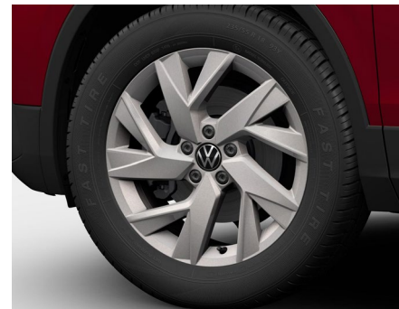
18-Zoll-Leichtmetallrad „Frankfurt“ 2

Serienausstattung Tiguan Allspace R-Line