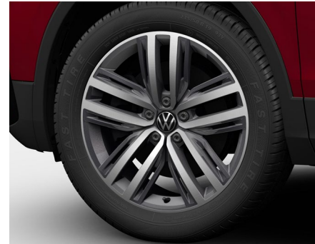
19-Zoll-Leichtmetallrad „Auckland“ 2

Optional für Tiguan Allspace Life und Tiguan Allspace Elegance