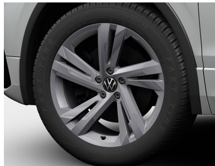
19-Zoll-Leichtmetallrad „Valencia“ in Grau Metallic 2

Serienausstattung Tiguan Allspace R-Line