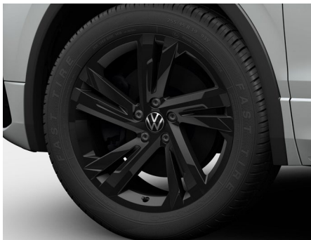
19-Zoll-Leichtmetallrad „Valencia“ in Schwarz 2

Serienausstattung Tiguan Allspace Elegance, optional für Tiguan Allspace Life