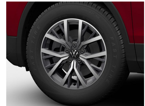
17-Zoll-Leichtmetallrad „Tulsa“ 2