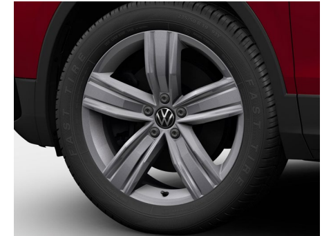
19-Zoll-Leichtmetallrad „Victoria Falls“ 2

Optional für Tiguan Allspace Life und Tiguan Allspace Elegance