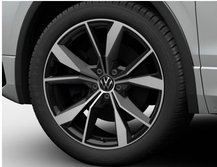
20-Zoll-Leichtmetallrad „Misano“ 2