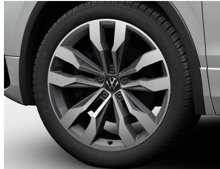
20-Zoll-Leichtmetallrad „Suzuka“ 2